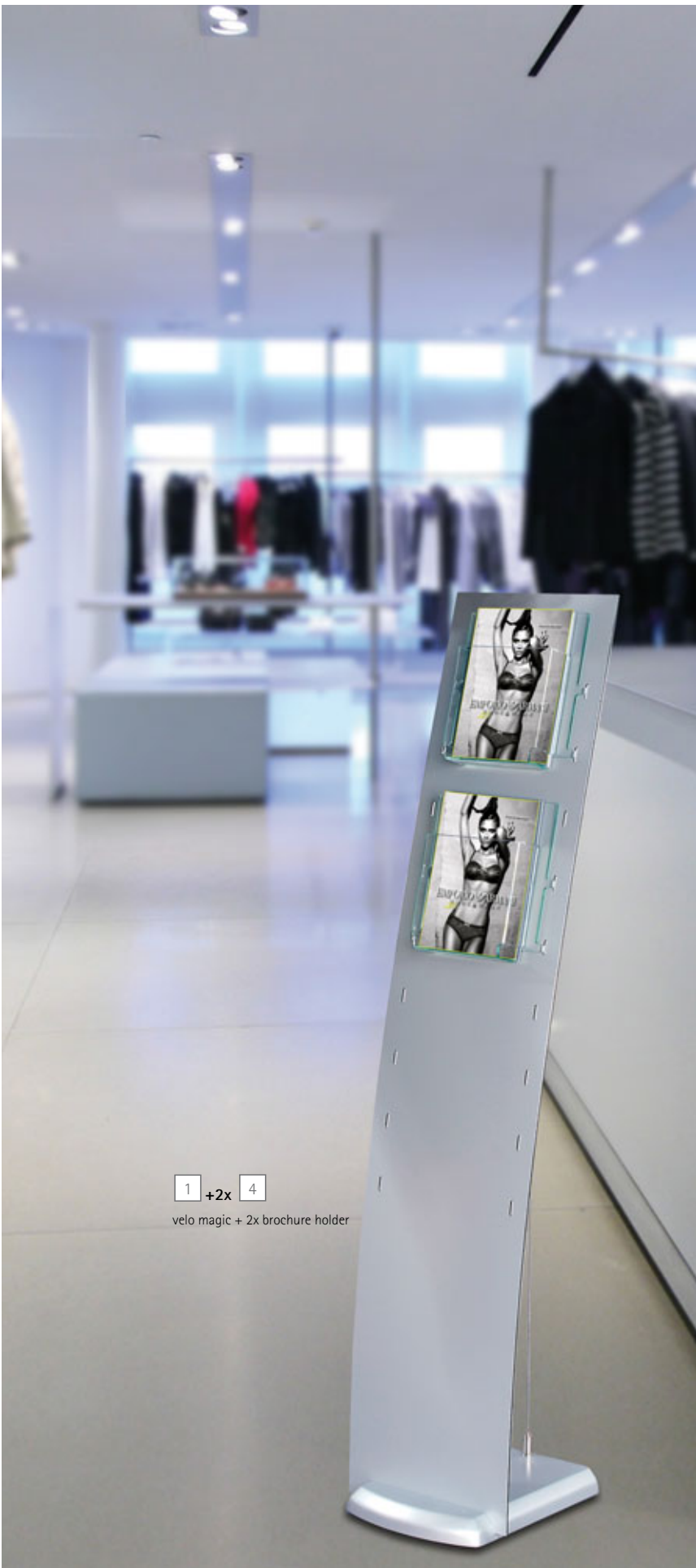
1 +2x 4 velo magic + 2x brochure holder